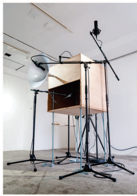
上野悠河 <時に、糺そうとする> 2021