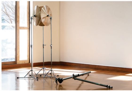
上野悠河 <2と3> 2021