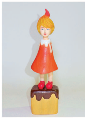
関口恵美 <蠟燭娘No.11> 2022