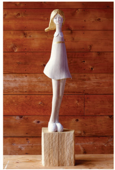
関口恵美 <一輪の花うた> 2021